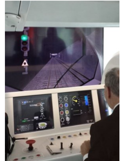
CFTA, perteneciente al Grupo Transdev, ha adquirido una licencia de estudio de GoalRail® para realizar simulaciones.

Para nuestra compañía, esta es una gran oportunidad para trabajar conjuntamente con uno de los grandes operadores internacionales del transporte ferroviario a nivel mundial como es el Grupo Transdev, que cuenta con un equipo de planificación de alto nivel y dilatada experiencia, y una excelente oportunidad de seguir participando en el ámbito de la liberalización del sector ferroviario en Europa.