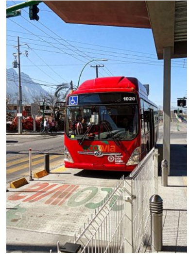
Ecovía es un proyecto que contempla la implementación de autobuses con las últimas tecnologías que circularán por carriles exclusivos

Este sistema contará con 112 autobuses de motores híbridos equipados con tecnología punta, que recorrerán una longitud de 30 kilómetros desde la estación Lincoln en Monterrey hasta la estación Valle Soleado en Guadalupe, con 40 estaciones intermedias.