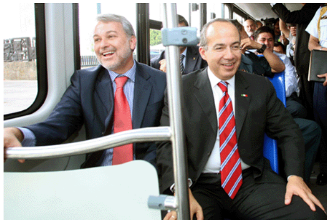
De visita en el Estado, el Presidente inauguró el nuevo sistema de transporte de Guadalajara.

En la Plaza Juárez, en compañía del gobernador del Estado, Emilio González Márquez, Calderón Hinojosa aseguró que: "El transporte en una ciudad tan grande como ésta y de la que todos los mexicanos nos sentimos tan orgullosos es un reto muy grande". Además dijo que el Macrobus es una muestra del espíritu de cooperación de los tres niveles de Gobierno –federal, estatal y municipal– y aseguró que con el nuevo sistema los pasajeros ganarán tiempo. También destacó que el llamado transporte articulado será un atenuante para el tráfico y la contaminación del aire en la metrópoli.